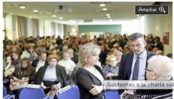
Asistentes a la charla sobre fibromialgia. Ángel González

Suelen ser mujeres, con una media de edad de 52 años, casadas y con un nivel de estudios modesto. Es la radiografía de los pacientes que sufren fibromialgia, una dolencia que afecta a más de 900.000 personas en España y que acaba de ser analizada en un estudio epidemiológico por primera vez en nuestro país. El documento fue presentado ayer en la Laboral, en el acto de conmemoración del Día Mundial de la Fibromialgia y la Fatiga Crónica, organizado por la Liga Reumatológica Asturiana.